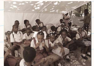
2010. 7【セスラ校 仮設教室】